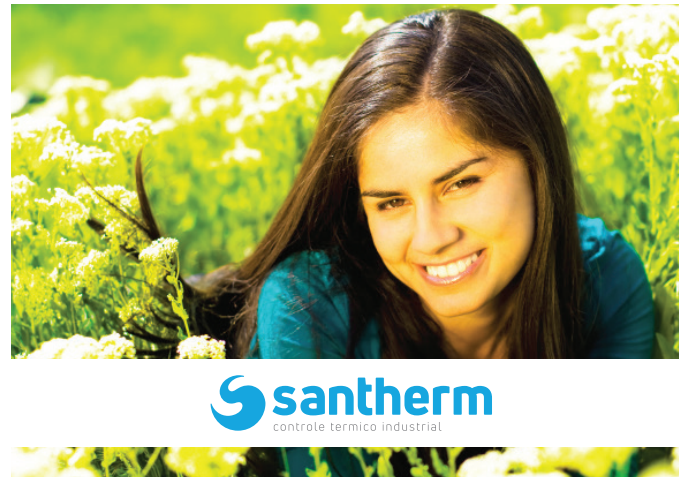
Imagem com tarja branca