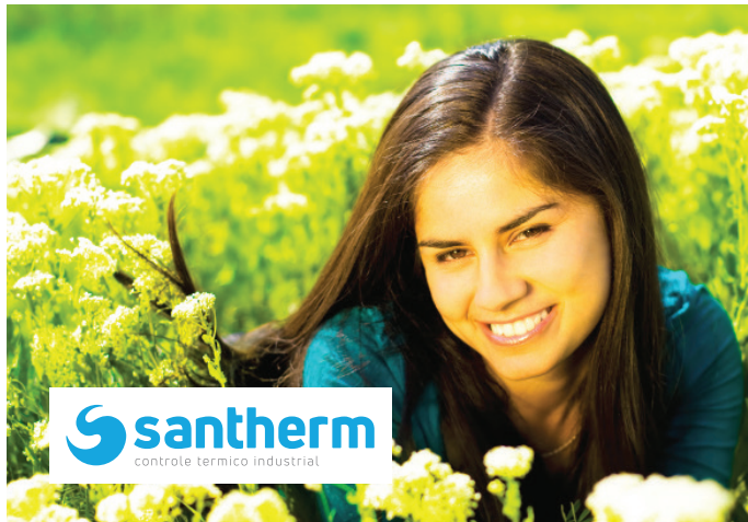
Imagem com box branco